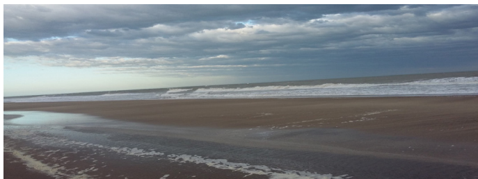
Fotografía 3. El Atlántico.